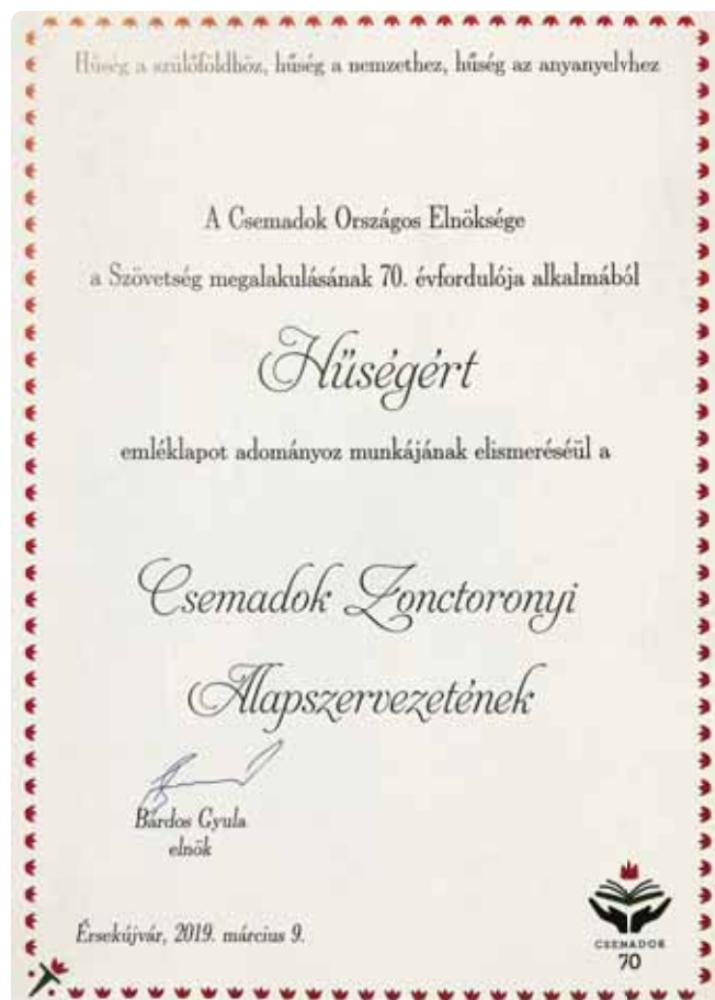
Pamätný ďakovný list a uznanie práce pre Csemadok v Turni

„Már több éve a faluban elkészítjük az adventi koszorút és pár nap múlva mindenkit szeretettel várunk a karácsonyi koncertre a helyi templomba“