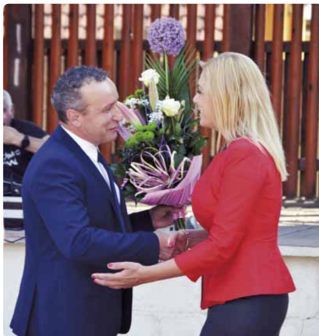
Pán starosta sa poďakoval ministerke vnútra SR pani Denise Sakovej

Obec sa zaviazala vozidlo využívať v súlade s jeho určením na účely detailne špecifikované v zmluve a udržiavať ho v technicky bezchybnom stave. Tiež uhrádzať z vlastných prostriedkov všetky náklady spojené s prevádzkou a s údržbou vozidla. Obec sa ďalej okrem iného zaviazala aj zabezpečovať, aby všetci členovia DHZ mali absolvovanú určenú odbornú prípravu a spôsobilosť podľa určených vyhlášok Ministerstva vnútra SR, aby sa členovia DHZ zúčastňovali na odborných a metodických školeniach a cvičeniach organizovaných územne príslušnou organizačnou jednotkou HZZ, aby bolo vozidlo trvale garážované vo vykurovanej (temperovanej) garáži hasičskej zbrojnice a zabezpečiť vybavenie všetkých členov DHZ osobnými ochrannými pracovnými prostriedkami s uvedením jednotného označenia obce.