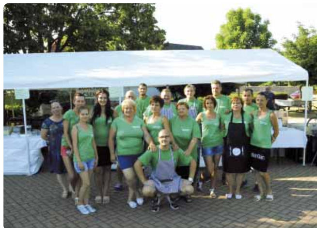
Deň obce, júl 2019

„Počas uplynulých 50 rokov boli veľmi atraktívne spoločenské hry v nedeľu popoludní, kurzy šitia a tanečné kurzy, posedenie po vino-braní a fašiangové zábavy, diskotéky, súťaže v prednese poézie, koncerty, návšteva divadelných predstavení, výstava starožitností, remeselnícke výstavy a takisto deň detí.“